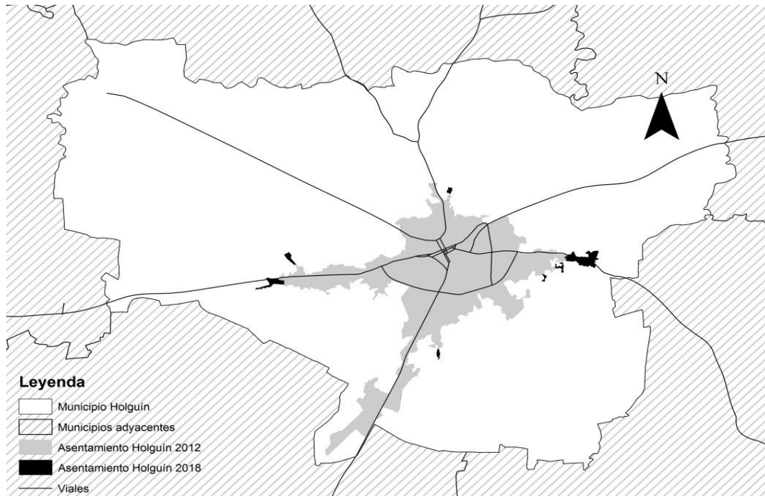
Figura 3. Fusiones urbano-rural. Municipio Holguín.